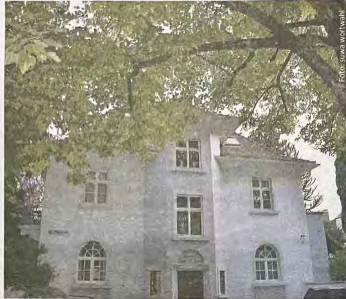
Vorzeigehaus im Viertel: die Pfähler Villa.

Der Offenburger Josua Kühne hat in der Straße Im Pfählerpark 1 das Haus vis-à-vis des einstigen „Schlössle“ erworben. Geschaffen wurde es 1936 vom Zigarrenfabrikant Faißt aus Ober- und Niederschopfheim, wurde zuletzt nur noch von einer Person bewohnt und soll nun für die junge Familie Kühne aus dem Dornröschenschlaf erweckt werden. Viele Fenster, ein Wintergarten mit innenliegendem Brunnen sowie